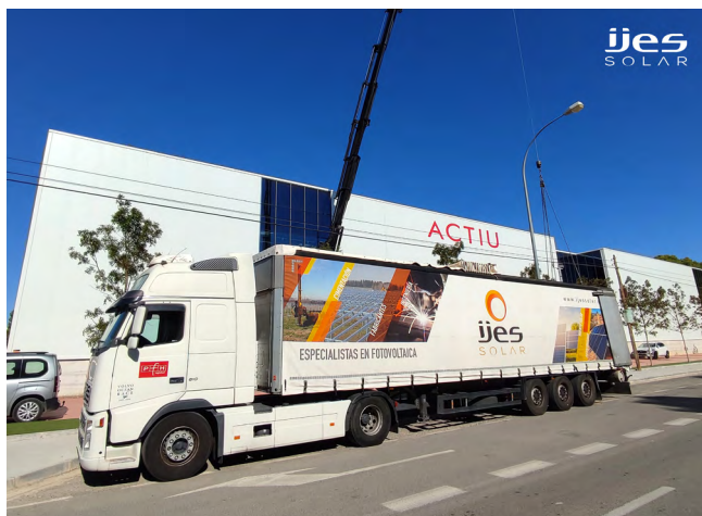
/ Empresa instaladora Fronius System Partner durante la entrega del material fotovoltaico